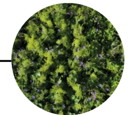
Recycelbare und vorab bepflanzte und kultivierte Kassetten